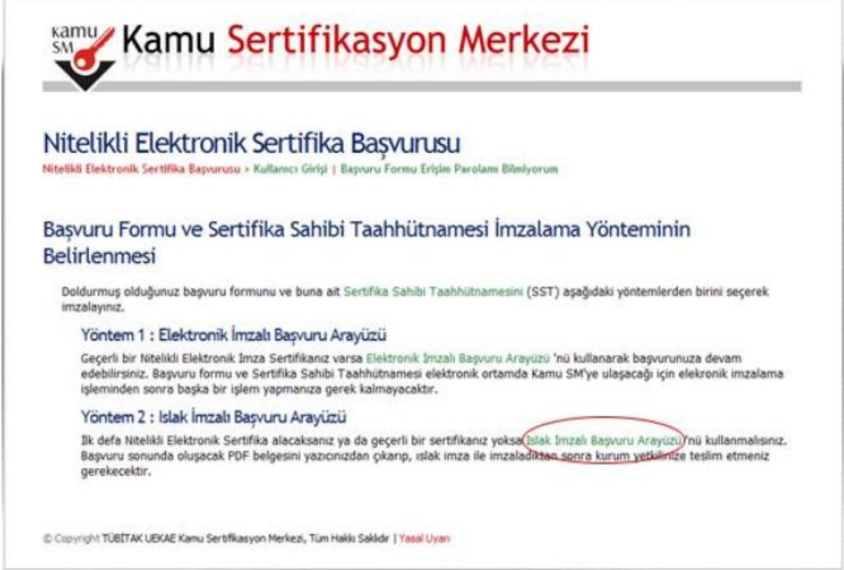
Şekil 9 İmzalama Yönteminin Belirlenmesi

SMS onayından sonra gelen ekranda doldurulmuş olan Başvuru Formu ve Sertifika Sahibi Taahhünamesinin hangi yöntemle imzalanacağı sorulmaktadır. Bu ekranda (daha önce e-imza alınmadığı için) Yöntem 2: Islak İmzalı Başvuru Arayüzü kısmı seçilmelidir. (Bkz. Şekil 9)