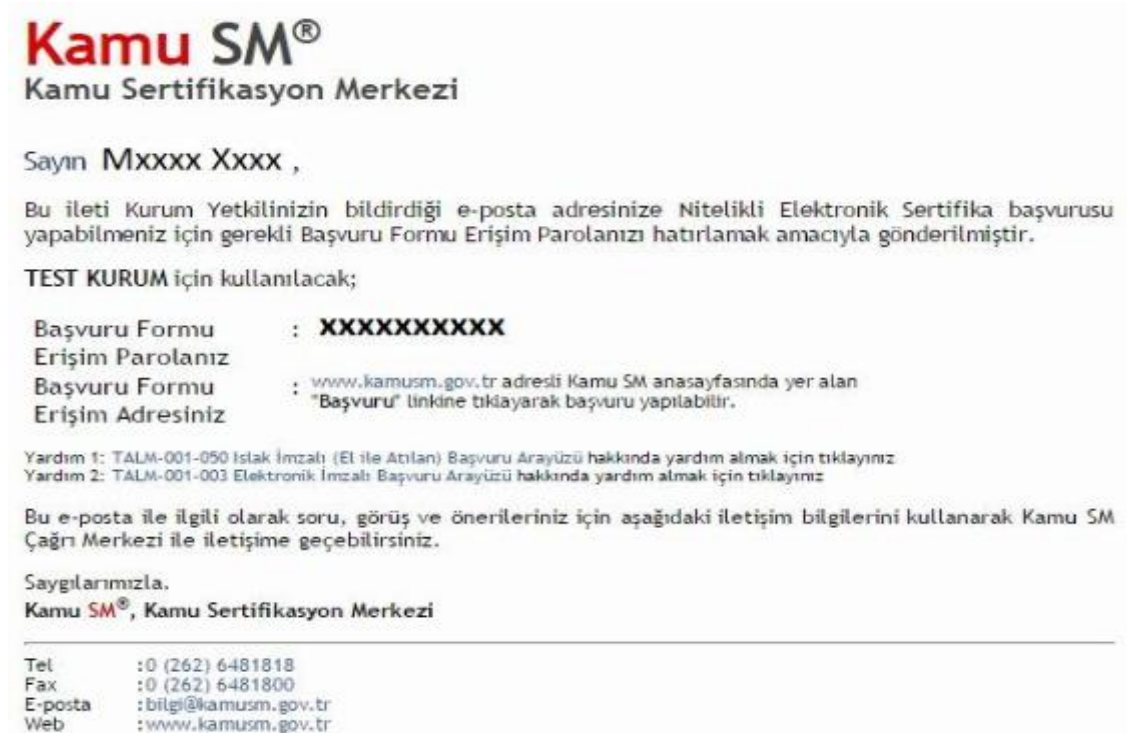
Şekil 1 Başvuru Formu Erişim Parolası e-postası

Kamu SM tarafından (basvuru@kamusm.gov.tr), kurum yetkilisinin bildirdiği kişilere, gereken başvuru formu erişim parolası e-posta ile gönderilmektedir. Bu e-postada aynı zamanda ilgili kanun maddesi ve erişim için gereken bağlantı bilgileri yer almaktadır. (Bkz. Şekil 1) (Bkz. Şekil 2)