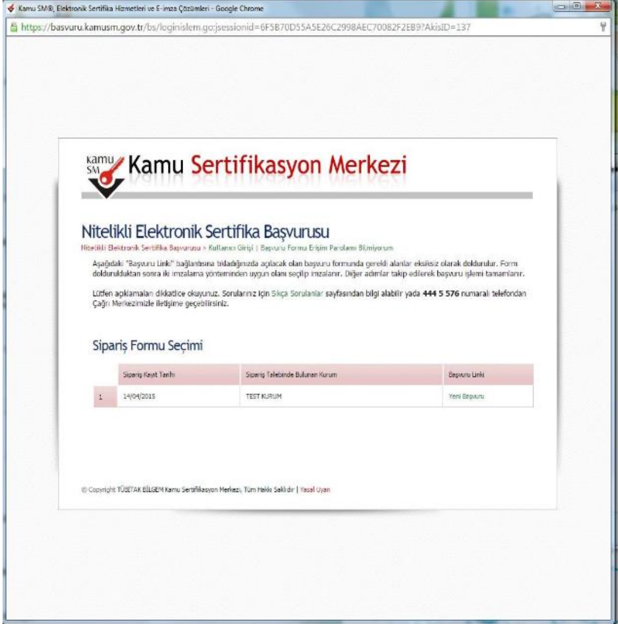
Şekil 5 Sipariş Formu Seçimi

Doğru bilgilerle, kullanıcı girişi yapıldığında "Sipariş Formu Seçimi" ekranı gelmektedir. İlk defa Nitelikli Elektronik Sertifika başvurusunda bulunmak için gelen listede "Yeni Başvuru" linkine tıklanmalıdır. Eğer daha önce form doldurulmuş ise ve güncelleme yapmak gerekiyorsa "Önceki Başvuru" linkine tıklanmalıdır. (Bkz. Şekil 5)