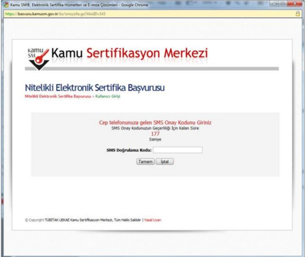
Şekil 8 Başvuru SMS Onayı Girme Ekranı

Cep telefonuna gelen SMS Onay Kodu ilgili yere girilmeli ve “Tamam” tuşuna basılmalıdır. (Bkz. Şekil 8)