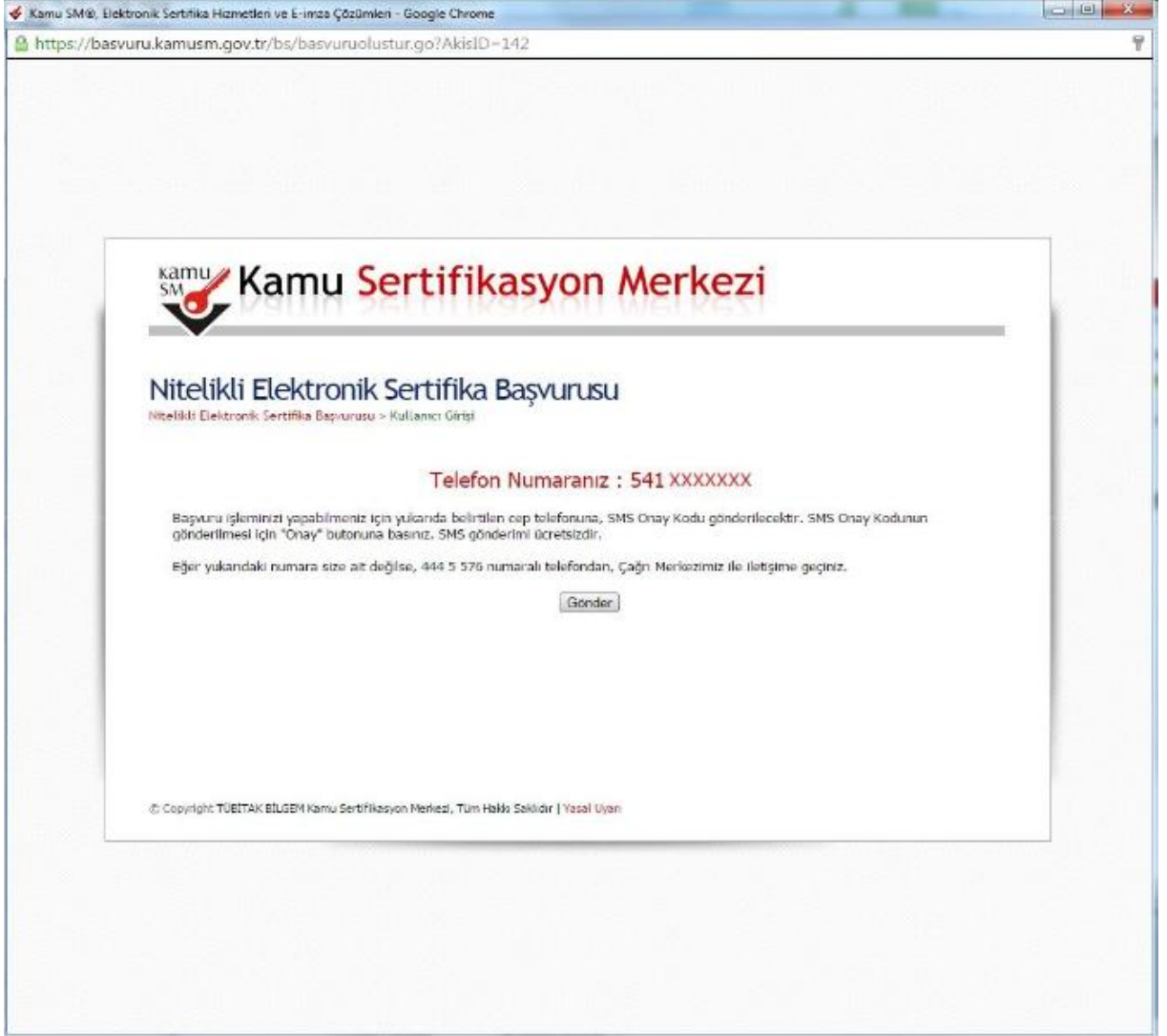
Şekil 7 Başvuru SMS Onayı İstemi

Başvuru işlemine devam edilebilmesi için (güvenlik gereği ile) başvuruda girilmiş olan cep telefon numarasına, Kamu SM tarafından SMS Onay Kodu gönderilecektir. Bu kodun gönderilmesi için ekrandaki “Gönder” butonuna basınız. (Bkz. Şekil 7)