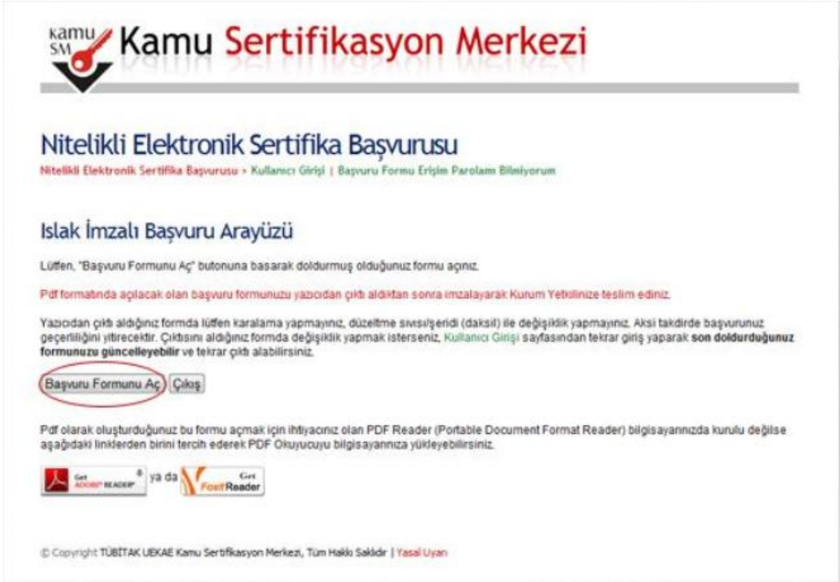
Şekil 10 Başvuru Formu Aç

Oluşturulan başvuru formu "Başvuru Formunu Aç" butonuna tıklanarak açılmalıdır. Başvuru formu PDF formatında oluşturulmaktadır. PDF okuyucu ile sıkıntı yaşanması durumunda biriminizin bulunduğu Bilgi İşlem Teknik Servisinden destek alabilirsiniz. (Bkz. Şekil 9)